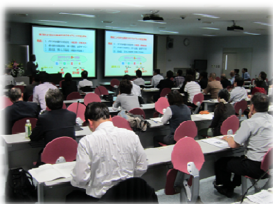
2012 カツオセミナー in 高知 (H24.5.12)